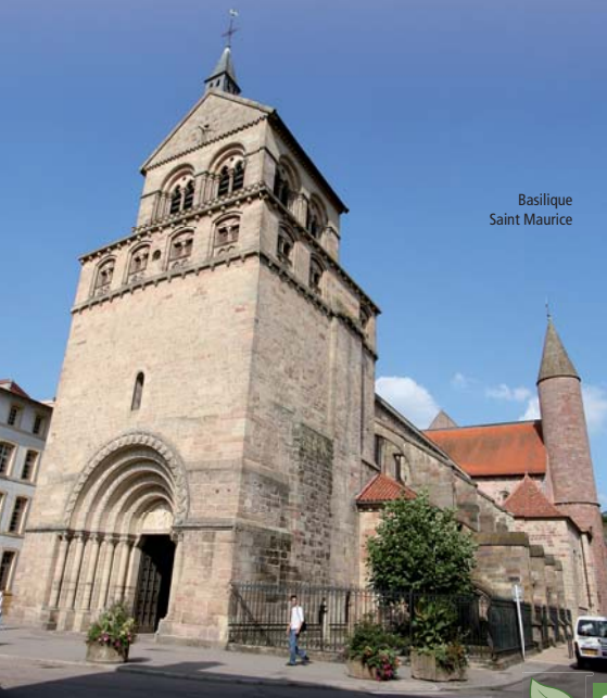
Basilique Saint Maurice

Situé à deux pas du centre ville, le parc du château offre aux Spinaliens et touristes de passage le loisir de prendre le temps... Profitez donc un peu de la vue sur la cité du bois et des images qu'offre le somptueux parc de l'ancienne forteresse.