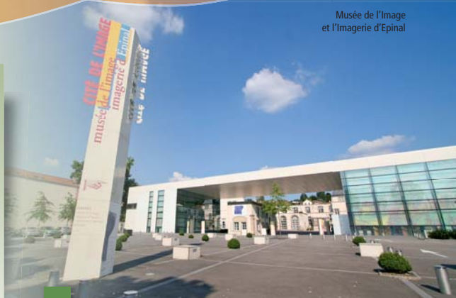
Musée de l'Image et l'Imagerie d'Épinal

Depuis toujours, l'homme utilise l'image pour communiquer.