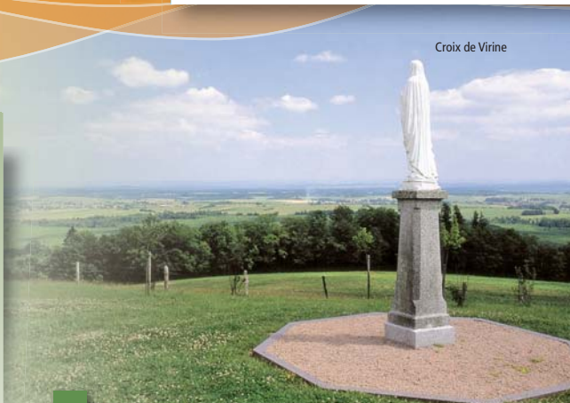
Croix de Virine

Recommandation : Prudence lors de la traversée des routes départementales