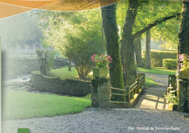
Parc thermal de Bains-les-Bains

Accès : depuis Epinal, suivre la D 434 en direction de Xertigny.