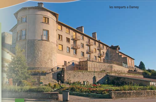
les remparts à Darney

Niveau : de 0 à 5 (5 étant difficile) : niveau 1