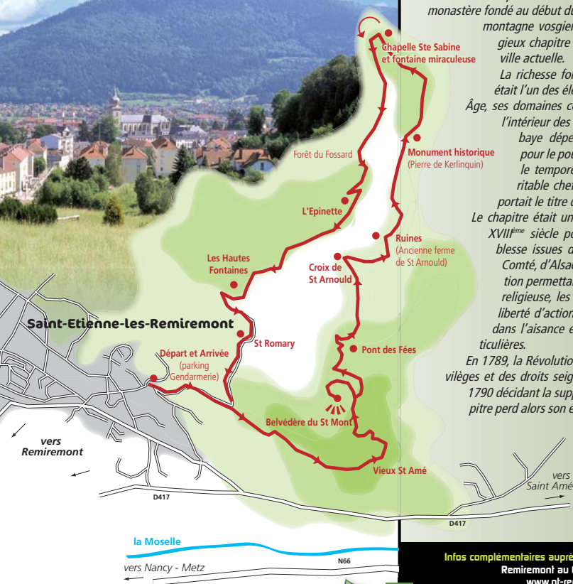
Remiremont "la Coquette" Porte des Hautes Vosges

Depuis le Pont des Fées, St-Amé, St-Arnould, St-Romary et Sainte-Sabine se rassemblent... comme par le passé.