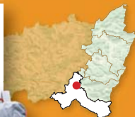
Carte : D5

Au retour, empruntez les larges chemins de forêt qui redescendent vers la vallée. Balisés (triangle rouge) vous les suivrez jusqu'à «l'Épinette». Un ancien et étroit sentier (toujours triangle rouge) appelé le chemin «Dieterlin» traverse la forêt vers les Hautes-Fontaines et la cascade de St-Romary.