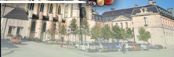
Palais abbatial de Remiremont et son Abbaye