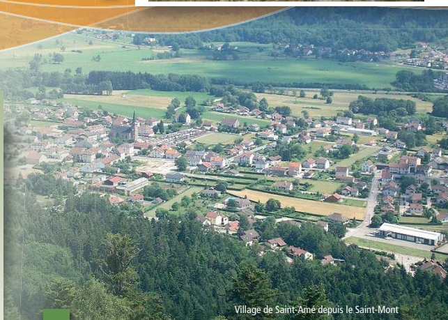
Village de Saint-Amé depuis le Saint-Mont

tée. Bienvenue dans la forêt, refuge des animaux, des plantes sauvages mais aussi des anciens prieurés... Témoins fidèles du passé, les ruines de l'ancienne ferme de St-Arnould et l'extraterrestre monolithe de Kerlinquin ! Il est classé monument historique. La présence de ce colossal bloc de grès reste une énigme ! Sur une des faces, une inscription datant de 1897 laisse rêveur !