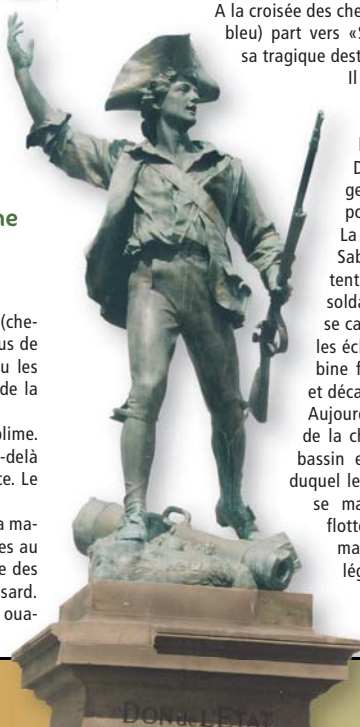
Le Volontaire de Remiremont

Aujourd'hui, à quelques pas de la chapelle, la source et son bassin en grès rouge sur l'eau duquel les jeunes filles en mal de se marier tenteront de faire flotter une aiguille, gage d'un mariage dans l'année, dit la légende.