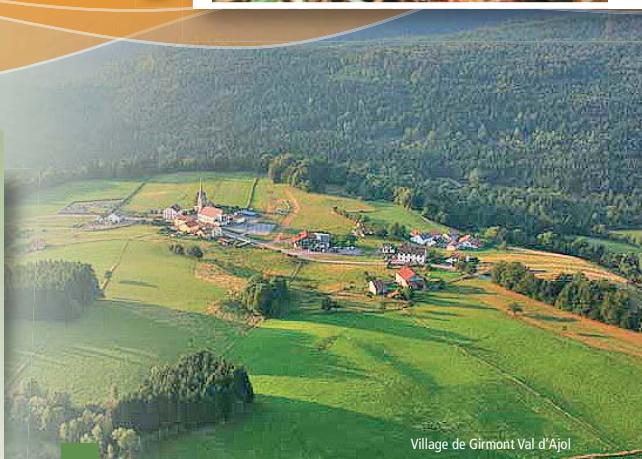
Village de Girmont Val d'Ajol

Niveau : de 0 à 5 (5 étant difficile) : niveau 3