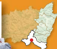
Carte : D5

le tranquille hameau du Haut du Mont. Sous le couvert d'une dense forêt de résineux, l'étroit chemin plonge une nouvelle fois vers les Haies Vallées. A la rencontre du bitume de la route, remontez la voie immédiatement à gauche jusqu'au hameau du Saucley perché à 499 mètres d'altitude.