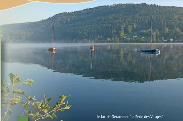
le lac de Gérardmer "la Perle des Vosges"

Observations : Des dispositifs permettent aux piétons de faire le tour du lac sans problème. Néanmoins il convient de rester vigilant aux abords des routes D417 (la route d'Epinal et de Remiremont) et la D69, route du tour du lac.