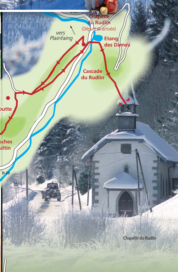
Chapelle du Rudlin